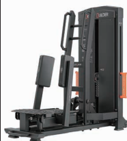
スタンディング アダクター