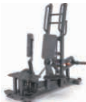
スタンディング アダクター