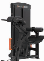
バックエクステンション