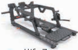
リバース スライディングランジ