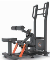
スタンディング ヒップスラスト