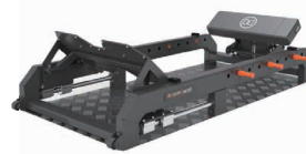
デュアルヒップスラスト