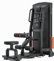
スタンディング ヒップスラスト