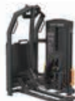
ペンデュラム ヒッププレス