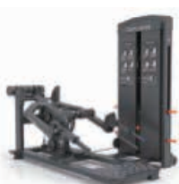
スプリットスクワット/ デッドリフト