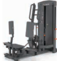
スタンディング アダクター