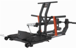
ベルトスクワット