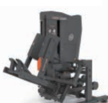
3Dマルチ アダクター