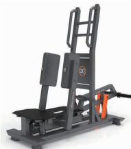
スタンディング アダクター