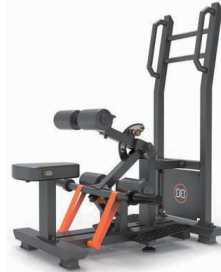
スタンディングヒップスラスト