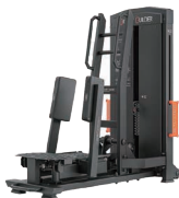
スタンディング アダクター