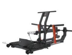
ベルトスクワット