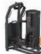
ペンデュラム ヒッププレス