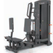
スタンディング アダクター