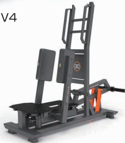
スタンディングアダクター