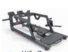
リバース スライディングランジ