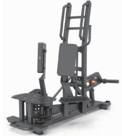
スタンディングアダクター