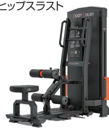
スタンディングヒップスラスト