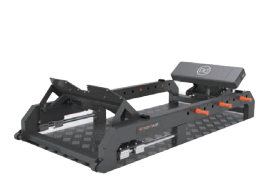
デュアルヒップスラスト